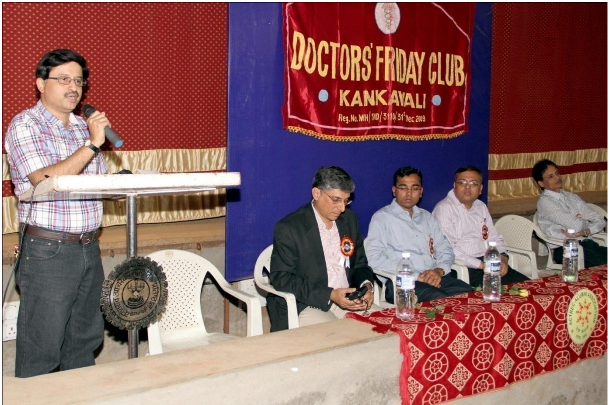
Public Awareness Lecture attended by housewives, senior citizens and youngsters of Kankavli